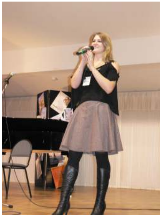
... et l'amour!!!

Tout est prêt pour les Grands Manoeuvres