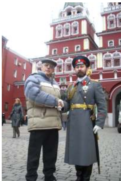
L'accueil chaleureux par le monarch russe

Regardez le reportage émouvant fait à la Place Rouge par notre photographe courageux.